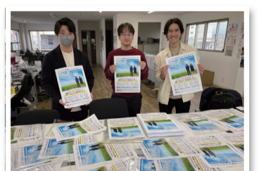
【株トラカップ ~Season 3~】 大会告知ポスターを学校へ配布