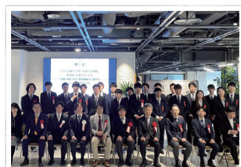
【株トラカップ ~Season 2~】入賞者表彰式典 入賞者、愛知県・名古屋市の管理職の方々と記念撮影 (2023.03.24ナゴヤイノベーションズホール)

世の中の「株式投資 = 怪しい」というイメージを払拭したいと、2021年10月に大学生向けに【株トラカップ ~Season 1~】を2022年10月に中高大学生向けに【~Season 2~】を開催。【~Season 3~】では、「日本の上場企業についてもっと知ってもらいたい」との思いから、全国大会に先駆け、地方大会(東海ブロック・関西ブロック・九州ブロック・関東ブロック)も開催予定です。