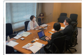
名古屋鉄道株様(銘柄コード/9048)

*愛知県名古屋市の40%以上の上場企業を取材させていただきました(2023年9月現在)