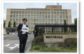
東邦ガス株様(銘柄コード/9533)