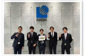
日本ガス株様(銘柄コード/5333)