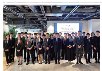
【株トラカップ ~Season 2~】入賞者表彰式典 入賞者、取材先上場企業の役員・管理職の方々と記念撮影 (2023.03.24 ナゴヤイノベーションズホール)