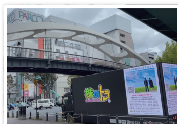
アドトラックによる【株トラカップ ~Season 3~】 大会告知プロモーション