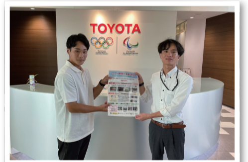
上場企業取材(一例/トヨタ自動車株様)