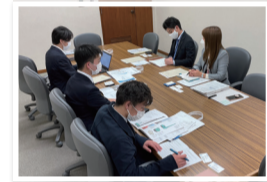
日本車輛製造株様(銘柄コード/7102)