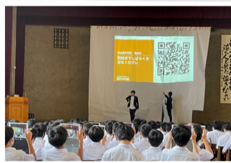
受講生徒 502名 が支給されたタブレットでQRコードを 一斉に読み込んでいる様子(愛知県 名古屋市)